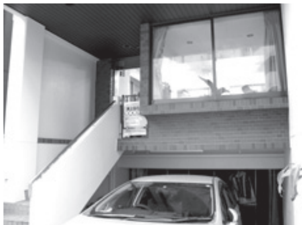
移転先フォロの正面

幸いにして、私たちは新しい拠点を確保できました。これまでの多くの応援と協力に感謝しつつ、これからは軸足を自分たちの足場