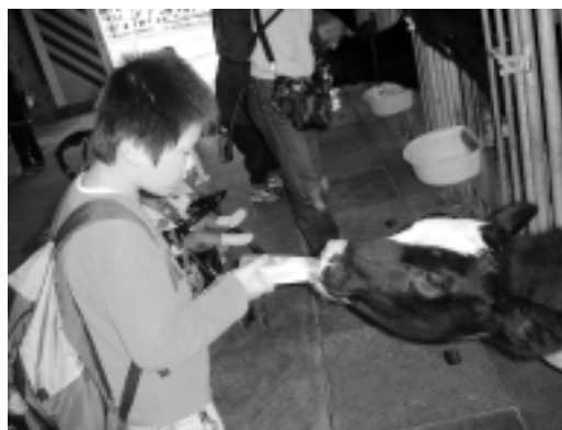
牧場で牛に授乳!? (11月)