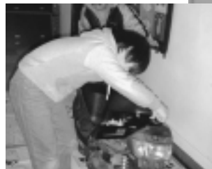
原付バイクを解体!! (1月)