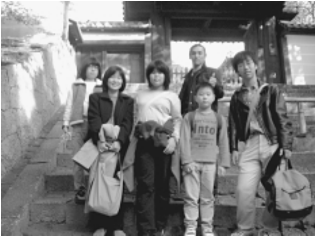
京都ミステリーツアー(11月)