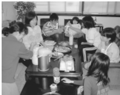
お茶会のようす(10月)

「英会話をやりたい」という声もあがっており、まずは英語を話す人に来てみよう、と、ブルガリアからの留学生の方に遊びに来ていただきました。言葉がままならなくてもジェンガなどの遊びで楽しみ、交流しました。